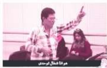
هوذا كعبه لوجهي