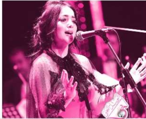
مهرجان جسر السويس لعساف