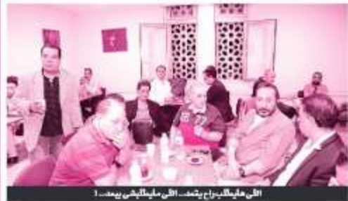
التي على الطاولة لم يتعدت التي ما قبلها... يمتد!