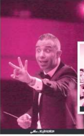
تكتلة تايعة... ماضي