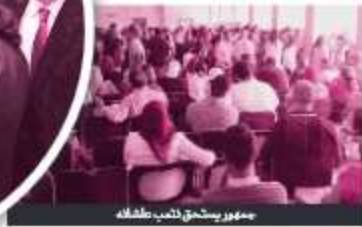
جمهور يستحق كعبه بكافه